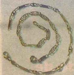
BRACELETS EN OR «Une découverte»

«C'est une femme que j'aime beaucoup qui me les a offerts. Elle m'a fait découvrir l'or. Avant, je ne portais que de l'argent ou de l'or blanc. Je les ai reçus pour mon anniversaire. Le 31 juillet, je fête mes 36 ans, peut-être aura-t-elle la bonne idée de m'en offrir un autre? (Rires)»