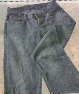
JEAN LEVI'S 545 «Il fait partie de ma vie»

«C'est une femme que j'aime beaucoup qui me les a offerts. Elle m'a fait découvrir l'or. Avant, je ne portais que de l'argent ou de l'or blanc. Je les ai reçus pour mon anniversaire. Le 31 juillet, je fête mes 36 ans, peut-être aura-t-elle la bonne idée de m'en offrir un autre? (Rires)»