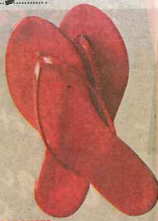
TONGS ROUGES Une folie à petit prix

«C'est ma meilleure amie, correspondante à Washington pour la TSR, qui me l'a offerte. Elle m'avait, cette fois-là, ramené des tas de cadeaux roses: tasse, assiettes, bol, brosse à dents... tout en rose!»