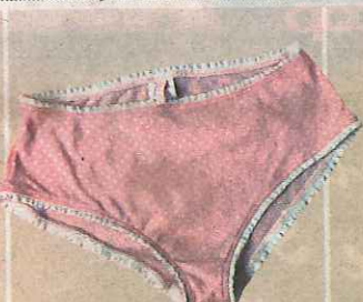
CULOTTE ROSE Cadeau à thème

«Le jean fait partie de ma vie. Il est dans tous mes bagages, et je le considère réellement comme un inséparable. Je choisisais des Levi's 501 mais, aujourd'hui, je préfère les 529 ou 545.»